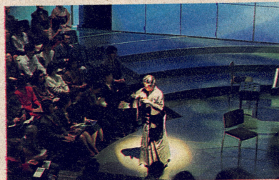
舞台からの香り、客席に回される香炉から直接溢れる香り。聴衆は音楽を聞くようにその匂いを聞く。