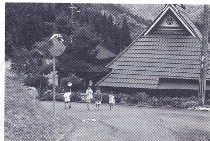
「トタンに感謝」美山町の民家。トタンの下には茅葺きがそのまま残されている。手前は、筆者の子供と友人。

1790年から1940年までの間、イギリスで茅葺きに使われた代表的な素材は小麦であった。品種改良により、藁の丈は平均120 cmから80 cmへと短くなった。短くなった茎と大き目の穂はシリアル生産者には好都合だったが、茅葺職人にとっては反対だった。手法や職人が同じでも材料が短くなったことで、屋根の寿命が縮み、よって茅葺きへの一般的評判が激しく低下したのである。一方で、ピクチャレスク運動やアーツ・アンド・クラフツ運動(1870~1900)に参加していた建築家たちによって、茅葺きの価値が再発見された。新建築の「洗練された」ブルジョワの茅葺きが人気を博し、必然的に、藁に比べ輸送、設計、適用が容易で清潔な(安価ではなかったが)ヨシの使用が圧倒的となった。その結果、茅葺きは事実上その農業背景から切り離されるようになったが、新しい茅葺建築はその可能性を探り、生き生きとした創造的なものとなった。しかし、残念ながら現在は自動「登録」され、地方当局の「合意」を要するイギリスの茅葺きは、歴史的観点からのみ考えられるようになってきている。ごく最近、古代植物学研究によって麦藁の古代品種の種が発見され、伝統回帰への動きがより活発化してきている。ヨシはいずれこ